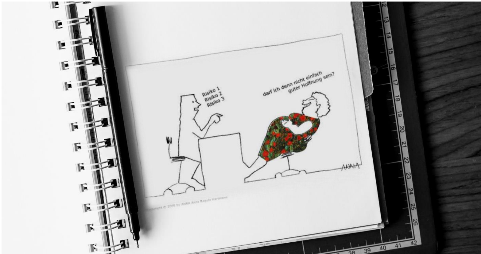
Bildquelle Karikatur: Copyright © 2005 by ANNA Anna Regula Hartmann

Während Schwangerschaft, Geburt und Wochenbett erhalten Sie von uns viele fachliche Informationen. Vorausssehbare Massnahmen wie z. B. Kontrollen, Blutentnahmen, Untersuchungen etc. thematisieren wir frühzeitig. Dies ermöglicht Ihnen eine freie Wahl.