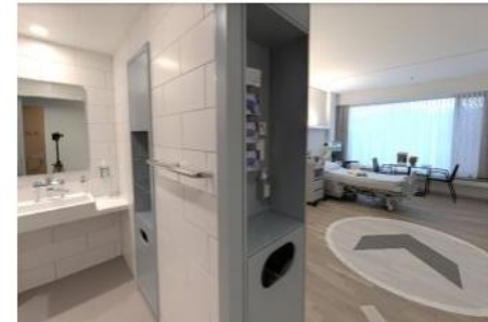
360°-Panoramafotos der Privat-Abteilung im Neubau Burgdorf